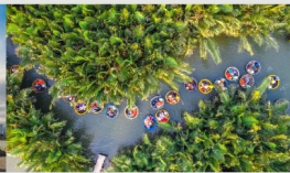
ล่องเรือกระดังงา

*กรณีห้องพัkbานาฮิลล์เต็ม ขอสงวนสิทธิ์ในการเปลี่ยนวันเข้าพัก และปรับเปลี่ยนโปรแกรมโดยคำนึงถึงผลประโยชน์ลูกค้าเป็นสำคัญ